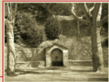
Font de Sta Catarineta