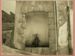
Font del Cerdanya