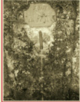
Font de la Teula