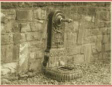
Font del Surtidor