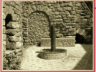
Font de l'Àbsis