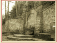
Font de la Margarideta