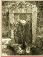
Font de Vistalegre