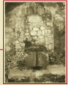
Font del Duc