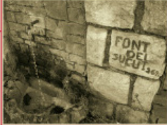
Font del Sucut