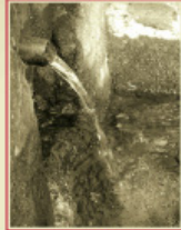
Font del Prat