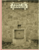
Font de Girafulles