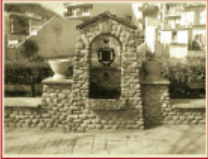
Font del Passeig