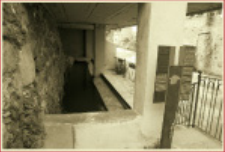
Font del Safareig