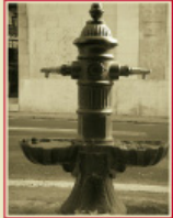
Font de St Quintí