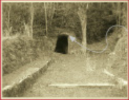
Font del Ferro