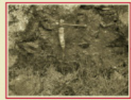
Font de St Cristófol