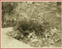
Font de la Fonderia