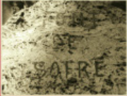
Font del Sofre