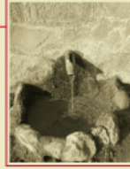
Font de Can Paletí